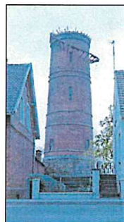
War eines der Wahrzeichen in Klein Faldern: der Wasserturm.