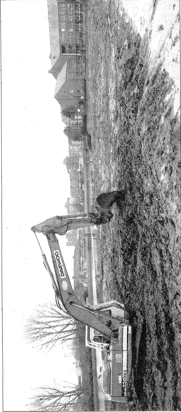
Viel Platz für neue Wohnungen: das ehemalige Bahngelände wurde in den letzten Monaten geräumt.

Zwei Grundstücke direkt am Wasser haben der Emdar Reeder Werner Bockstegel und der Bauingenieur und Planer