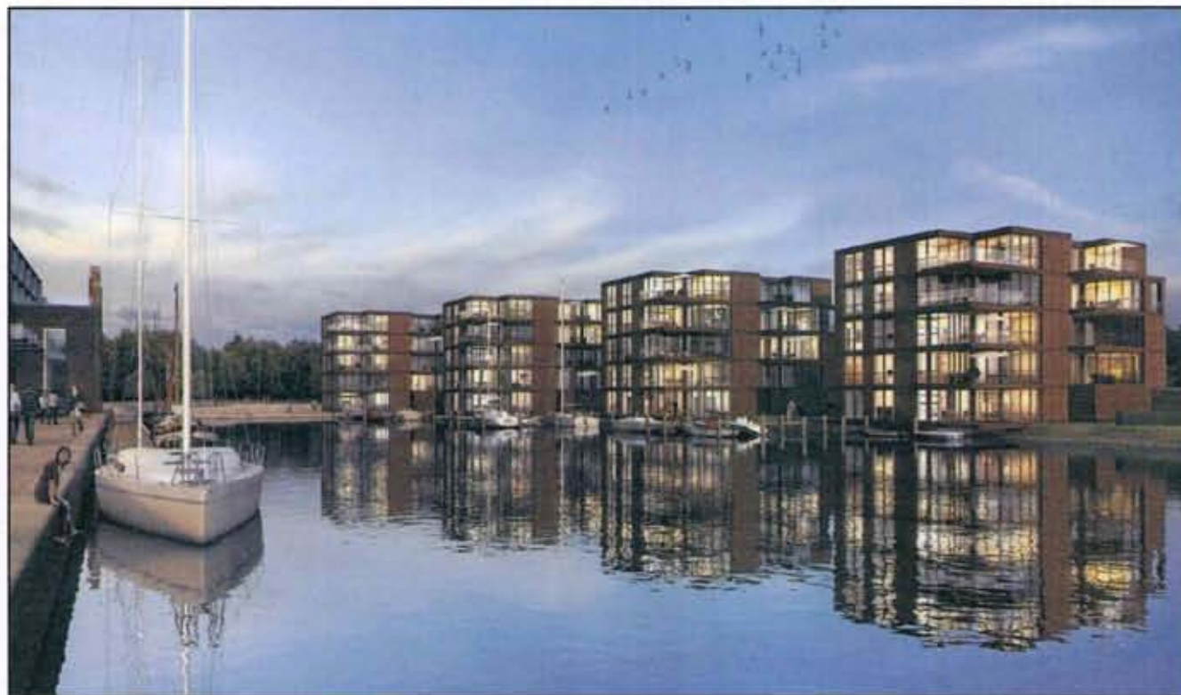
Nächtliche Hingucker: die vier geplanten Wohnhäuser am Eisenbahndock in einer Computergrafik. Im Hintergrund angedeutet: der geplante „Hafenplatz“ zwischen den neuen Häusern und dem Zollspeicher (links).

Wer es besonders geräumig mag, darf den übrigen Bewohnern der Stadthäuser aufs Dach